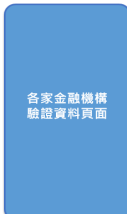
各家金融機構 驗證資料頁面

輸入金融機構驗證資料，選擇已啟用「台灣Pay」服務之帳號進行約定，完成綁定「台灣Pay LINE個人化服務」。