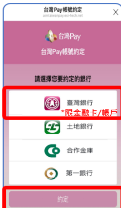
臺灣銀行 *限金融卡/帳戶