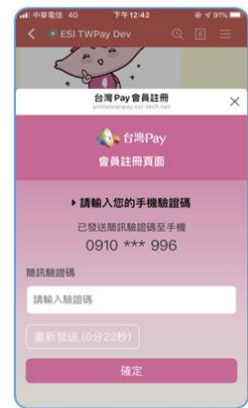
輸入手機簡訊驗證碼