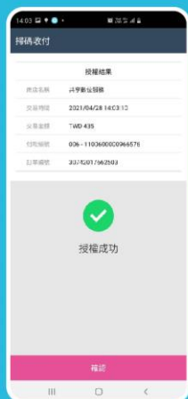
STEP 6 完成台灣Pay付款