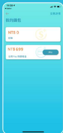
STEP 7 1. 「我的錢包」，顯示以台灣Pay支付預授權金實際金額 2. 點選左上方返回箭頭，跳回 ChargeSPOT APP 「租借畫面」