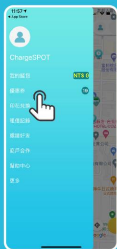
STEP 1 借電抵用券將於首次綁定「台灣Pay」(限使用金融卡/帳戶)完成後，自動匯入用戶的優惠券中，點擊 APP 主畫面上方大頭像圖示，開啟「功能選單」後，再點選「優惠券」即可查詢。