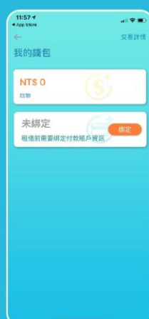
若暫時不使用可按退回(預授權金)即顯示「未綁定」，將返還預授權金699元